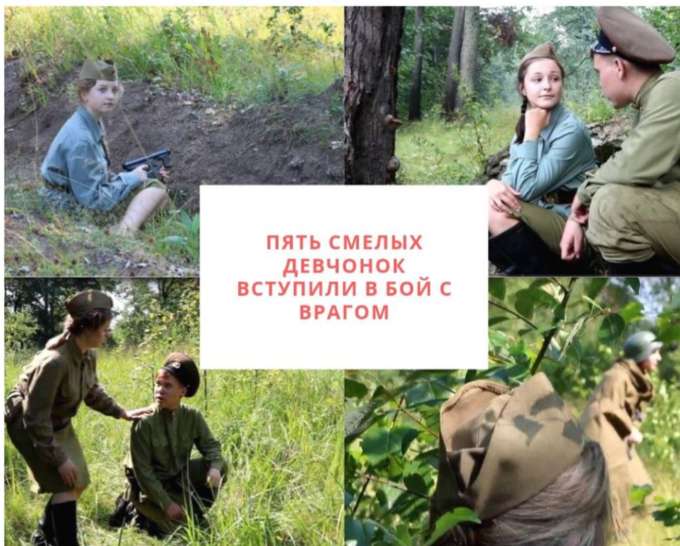
ПЯТЬ СМЕЛЫХ ДЕВЧОНОК ВСТУПИЛИ В БОЙ С ВРАГОМ