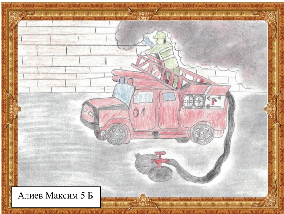
Алиев Максим 5 Б