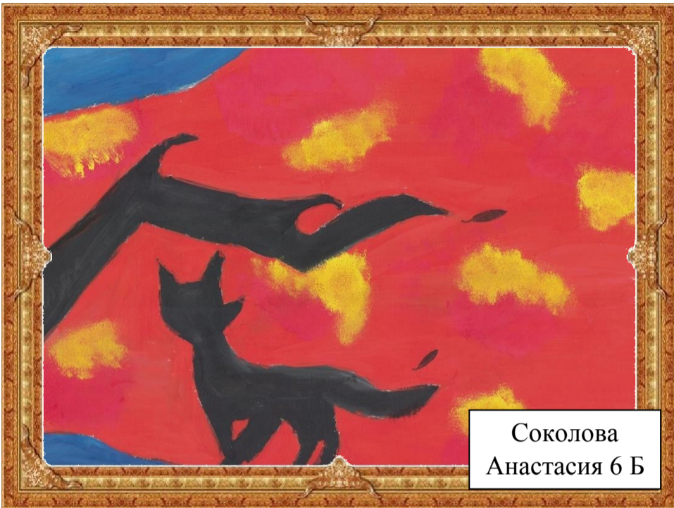
Соколова Анастасия 6 Б