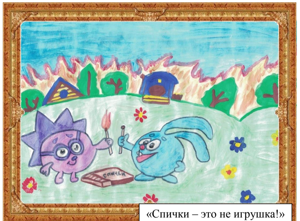
«Спички – это не игрушка!» Кротова Мария 6 Б