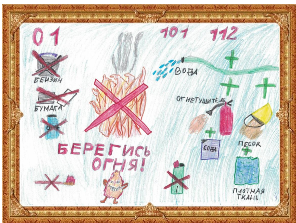
«Берегись огня!» Михеева Дарина 6 Б