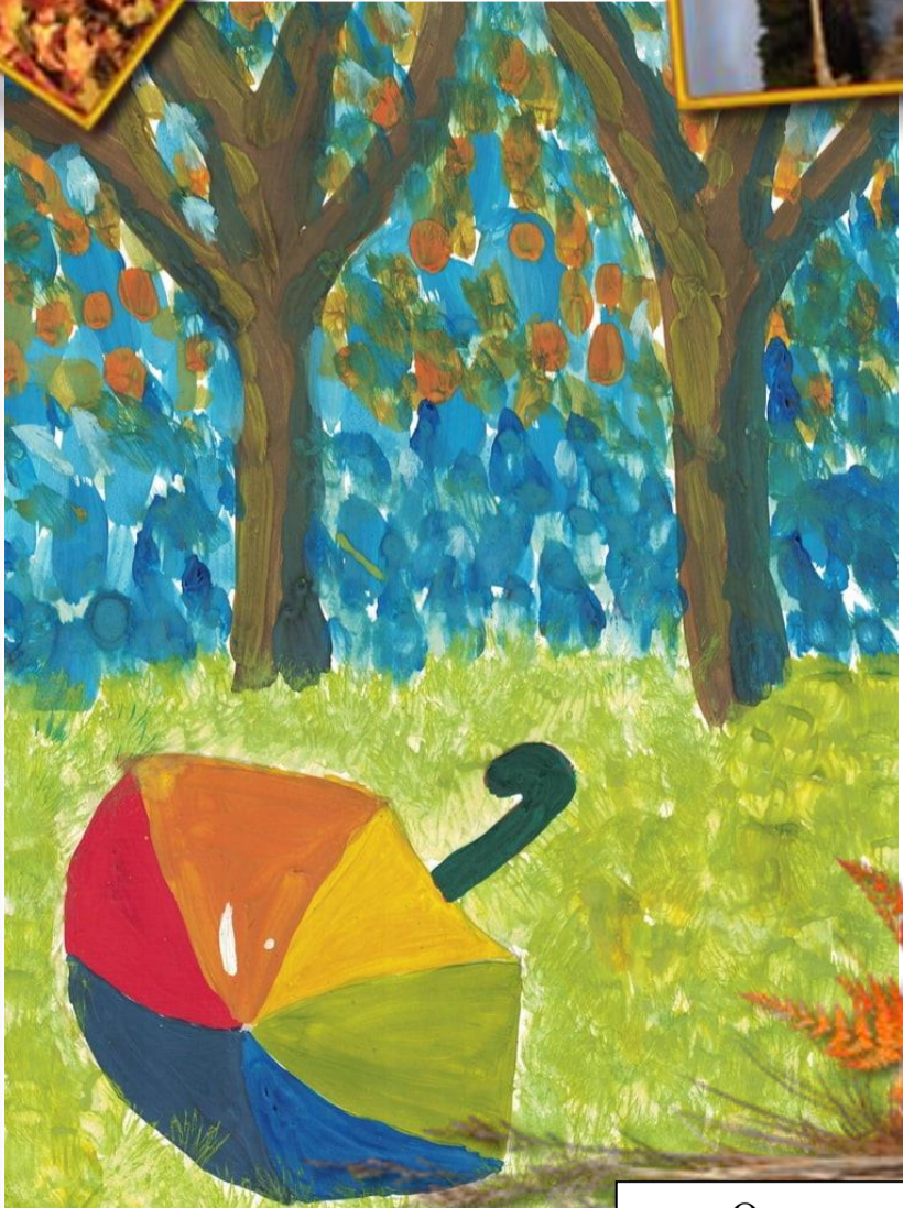
«Осень» Апринцева Алеся 6 Б